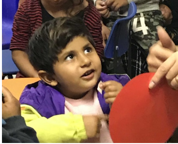
Kleuter op school in Tinca

In de eerste maanden dat we nu in Debrecen verblijven ligt de focus met name op intensieve taal- en cultuurstudie. We proberen ook zoveel mogelijk kennis op te doen van bestaande projecten in de wijde regio, om input te verzamelen voor ons project in Slowakije. Tijdens de conferentie in Tallinn leerden we Nicu Gal, president van stichting People2People