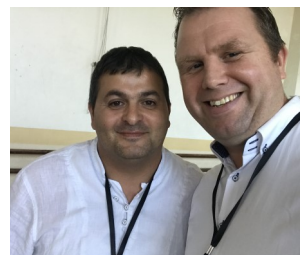
Nieuwe contacten opdoen

ken met diverse missionair werkers die in Roemenië, Servië, Bulgarije, Hongarije en andere Europese landen werken onder de Roma-bevolking. Veel ervaring kon worden uitgewisseld en voor ons was dit bijzonder leerzaam. Het mooiste was misschien