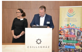
Voorstellen aan de kerk

Vrijdag 9 en zaterdag 10 november hadden we samen met twee collega's van het GZB-kantoor in Driebergen onze eerste persoonlijke kennismaking met de Hongaarse Hervormde kerk in Slowakije. We woonden een Roma-conferentie bij, waar alle betrokkenen bij het missionaire werk onder de Roma-bevolking aanwezig waren.